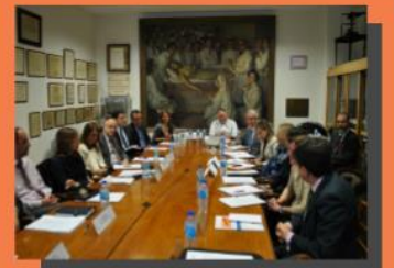
REUNIÓN GRUPO DE TRABAJO