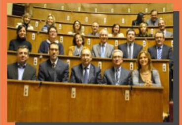
REUNIÓN DE COORDINACIÓN