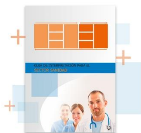
Guía de interpretación del Modelo EFQM