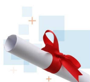
Premio de buenas prácticas