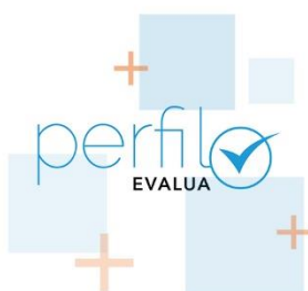
Adaptación Perfil autoevaluación