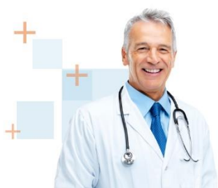
Reuniones con el Experto